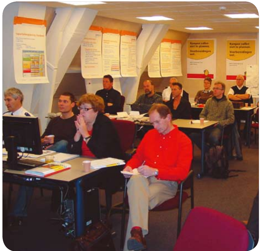
Deelnemers aan Fase I van Project WaVe bijeen