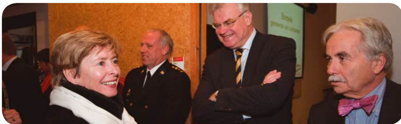
Ontvangst in de brandweerkazerne te Borssele

Veiligheidsregio Zeeland (alle Zeeuwse burgemeesters), de korpschef politie Zeeland en de directeur Veiligheidsregio Zeeland waren hierbij aanwezig.