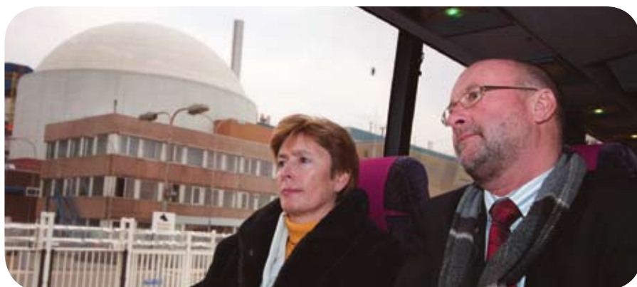
Tijdens een bustoer krijgt de minister uitleg over het risicoprofiel in Zeeland