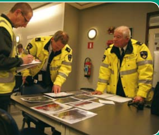
Leden van het COPI oriënteren zich op de situatie.

Middels de nieuwsbrief van Veiligheidsregio Zeeland en andere informatiekanaalen zult u op de hoogte gehouden worden van dit vervolgtraject.