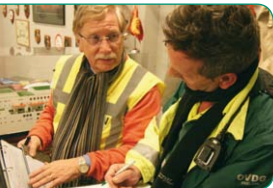
Officier van Dienst Geneeskundig legt aan observator van IOOV uit wat hij doet.