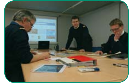
Brandweer in overleg.

De multidisciplinaire projectgroep RADAR-plus heeft de opdracht het vervolgtraject te coördineren en uit te voeren. Dit traject zal voornamelijk bestaan uit het reageren op de rappor-