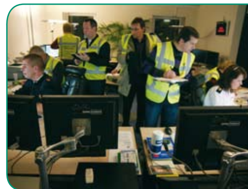
Drukke op de meldkamer.