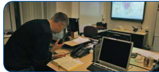
Actiecentrum waarschuwings- en verkenningdienst zoekt informatie op over de vrijgekomen stof.

ik moe maar voldaan op mijn gemakje, in de dichte mist en over gladde wegen, naar huis gereden.