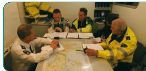
COPi-overleg in Verbindingscommandowagen (VC).

Al deze gegevens zijn nodig om een strategie te kunnen bepalen, besluiten voor te bereiden voor het beleidsteam en opdrachten uit te kunnen zetten naar de verschillende actiecentra.