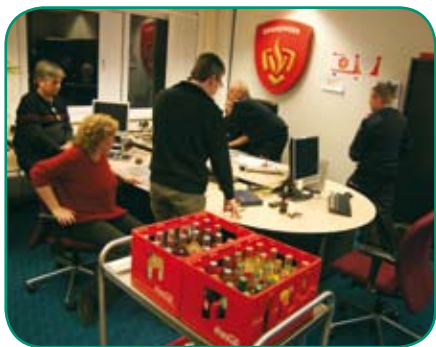
Ook aan de inwendige mens werd gedacht.

Ik vond de oefening niet lang duren en ben zeker een ervaring rijker.