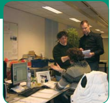
Actiecentrum Communicatie gemeente Terneuzen.