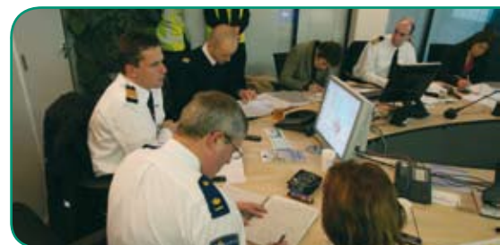
ROT in vergadering.