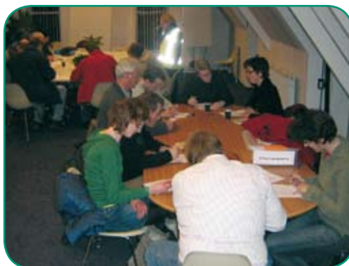
Medewerkers gemeente Terneuzen in overleg.