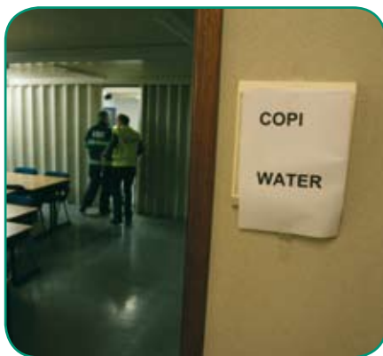
Conform het rampbestrijdingsplan Westerschelde was er zowel een COPI op het land als een COPI op het water.