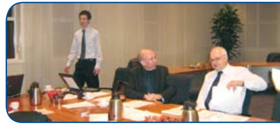
Gemeentelijk beleidsteam Terneuzen.

Aan het eind hebben we met de Inspectie geëvalueerd. Ik heb alleen maar complimenten gehoord. Om eerlijk te zijn, of dat door het late tijdstip kwam waardoor ik de kritiek niet heb gehoord, of omdat ze geen kritiek hebben geuit, weet ik niet. Na afloop ben