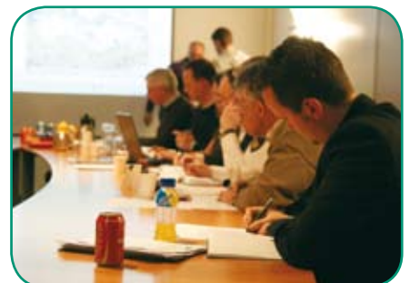
RBT in vergadering.