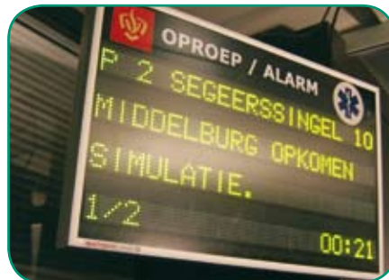
Functionarissen worden gealarmeerd met de melding 'simulatie'.

In deze RADAR-toets werd net als in oefeningen voor mij wederom benadrukt hoe essentieel de infrastructuur van de crisisinformatie is. Goede briefings en betrouwbare Sitraps vormen volgens mij de onmisbare 'slagader' van het rampbestrijdingslichaam. Omdat communicatie naar pers en publiek als het 'einde van de infopijpleiding' te beschouwen is, valt daar de kwaliteit van de informatiestructuur als het ware aan af te meten (maar overigens niet aan op te hangen). In dit geval was de uitkomst van de informatiestroom een gesimuleerde persconferentie, die meteen diende als afronding van RADAR. En zo eindigde de toets voor ons niet als een nachtkars die uitging, maar zoals de test begon: in volle vaart.