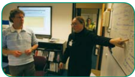
Het actiecentrum van de GHOR in overleg.