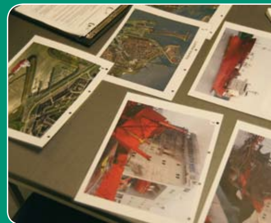
Diverse teams beschikten over foto's van de situatie, aangereikt door de IOOV.

Vermoedelijk werkt de inhibitor van zijn lading (T.D.I) TOLUEENDIISOCYANAAT niet goed, met als gevolg dat de temperatuur oploopt. Het is nu al zover dat de overdrukventielen op de tanks af en toe afblazen. Hiernaast bladert de verf t.h.v. 6 stuurboord en bakboord aan de bovenzijde al licht af. De temperatuur bedraagt nu 50 graden en loopt zeer snel op. De kritische temperatuur bedraagt 60 graden, waarbij er grote kans is op een snelle polyme-